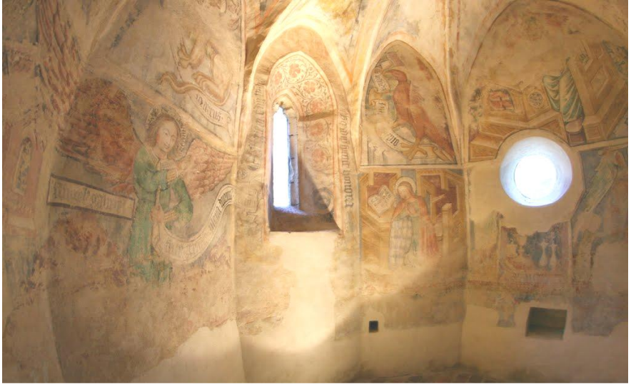
A veleméri templom

A programjainkat és a heti evangéliumrészeket külön ismertetőnkben tesszük közzé.