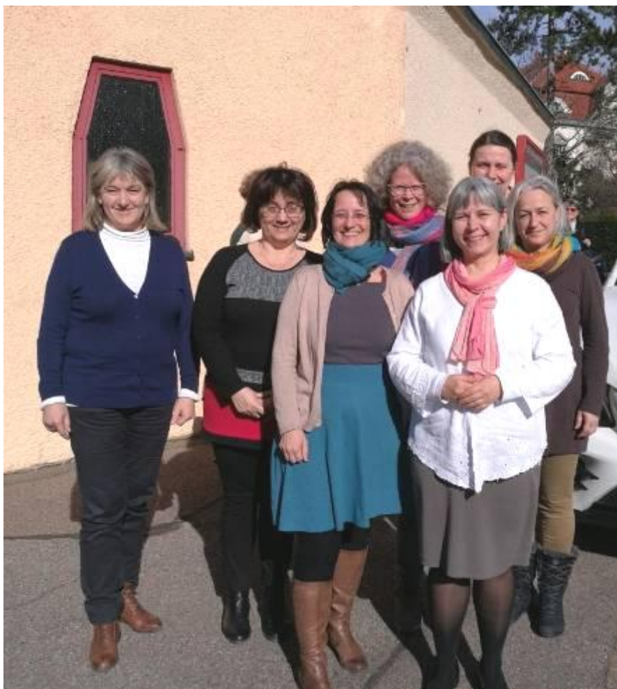
A stuttgarti pappá szenteléseken részt vevők Magyarországról