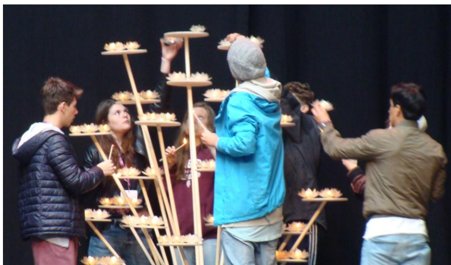
A tavalyi ifjúsági találkozón Hollandiában